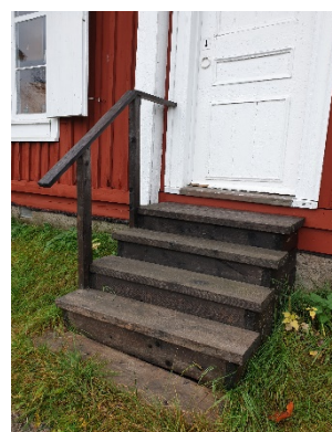
Smäcker och enkel variant av handledare på trätrappa.