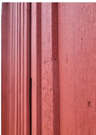
Panellist skarvad med ett snitt snett utåt för lättare vattenavrinning.