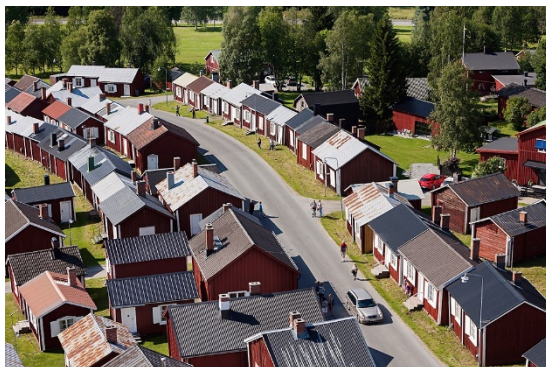
Mångfald av takmaterial i kyrkstaden.