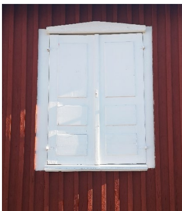
Beslag målad med vit linoljefärg.