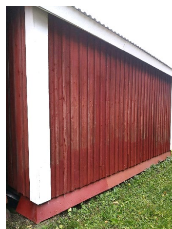
Plåtbeklädnader får inte förekomma.