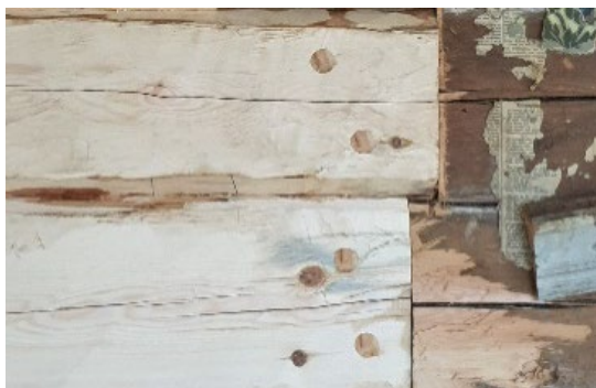
Handbilat timmer, skarvat halvt i halvt med originalstockarna. Fransk skruv har dolts bakom träplugg.