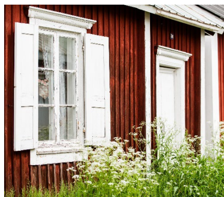
Hängränna endast över dörr är att föredra. Rännan har samma kulör som bakomliggande yta.