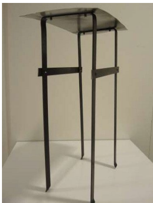
Placeras så benen tar i skorstensväggarna och plattjärnen stöttar mot skorstenskransen.