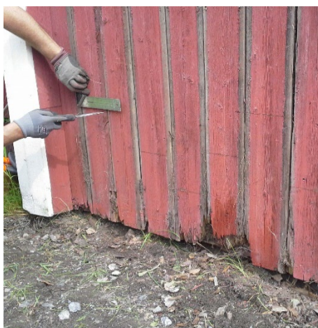
Ersätt bara den skadade panelen, variera skarvarna i höjd.