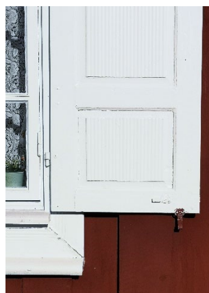
Fönsterbeslag målad med vit linoljefärg. Fönsterhake målad med röd slamfärg.