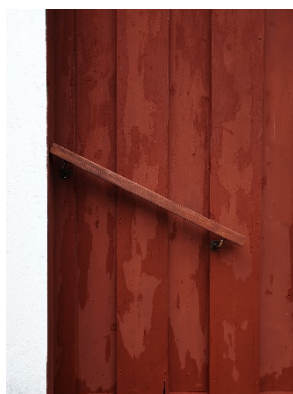
Handledare på vägg, målad i samma kulör som bakomliggande yta.