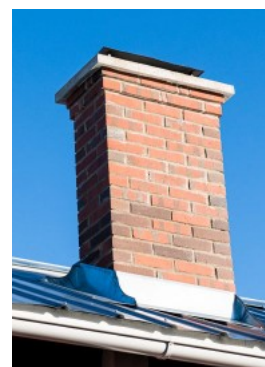
Skorsten murad med schatterat tegel, låg plåtstos mot taket.