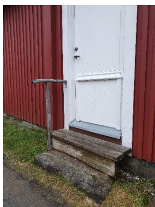
Smäcker och enkel variant av handledare på trä- och stentrappa.