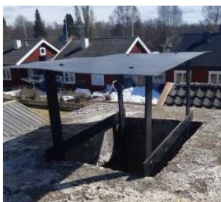
Skorstenstakets placering på kransen.