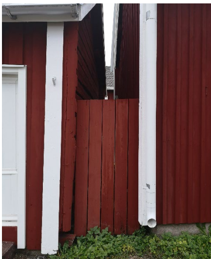
Stäng smog mellan kyrkstugorna, olämplig ur brandsynpunkt.