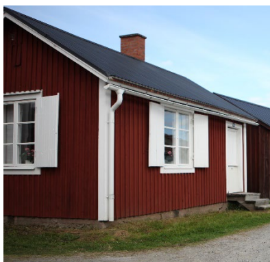
Vit hängränna och stuprör har samma kulör som bakomliggande yta.