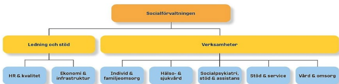
Figur 1: Organisationsskiss socialförvaltningen.

Av intervjuerna framgår att förvaltningens HR-funktion är centralt organiserad inom HR- och kvalitetsavdelningen. HR-funktionen erbjuder verksamhetsnära stöd, där HR-konsulter följer olika verksamhetsområden och bistår cheferna i personalärenden samt frågor som rör arbetsmiljö.